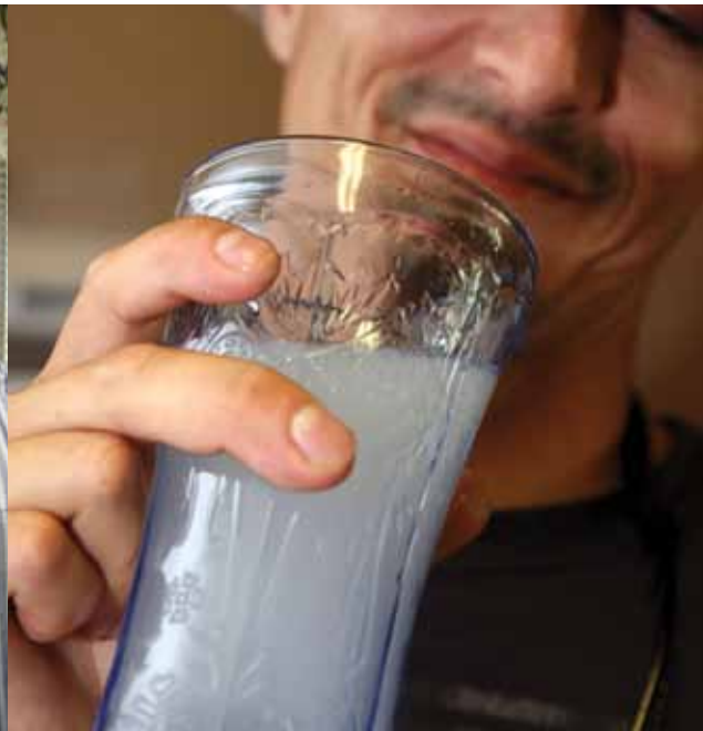
Los residentes de Lanare en el condado de Fresno están exigiendo fondos gubernamentales para arreglar o reemplazar los sistemas de agua potable contaminados y en malas condiciones.

Debido a que las comunidades informales no tienen autoridad o presupuestos propios, dependen de las decisiones de los condados, del trabajo de los consejos de administración de supervisores y de las agencias que a menudo ignoran estas áreas. Las comunidades informales tampoco han recibido una parte justa de los fondos estatales y federales para los sistemas de agua y otra infraestructura.