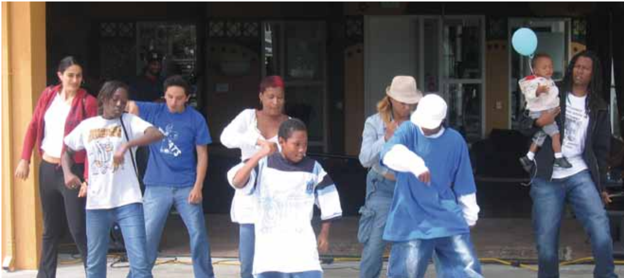
Youth UpRising provee programas de liderazgo, educación, artes y cultura y también otras lecciones de la vida a jóvenes en el este de Oakland.

Youth UpRising (YU) es un centro juvenil de liderazgo y desarrollo en el este de Oakland. Está en una comunidad llena de pobreza, deserción escolar, desempleo, abuso de sustancias endémicas y una violencia desenfrenada. El proyecto surgió de las necesidades expresadas por los estudiantes después de que las tensiones raciales en la preparatoria Castlemont se convirtieron en violentos enfrentamientos en 1997. La visión de Youth UpRising es construir una comunidad sana y económicamente fuerte aprovechando el liderazgo de los jóvenes quienes quieren convertirse en los agentes de cambio.